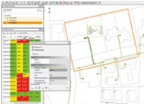
Berechnungsergebnis einer Netzberechnung